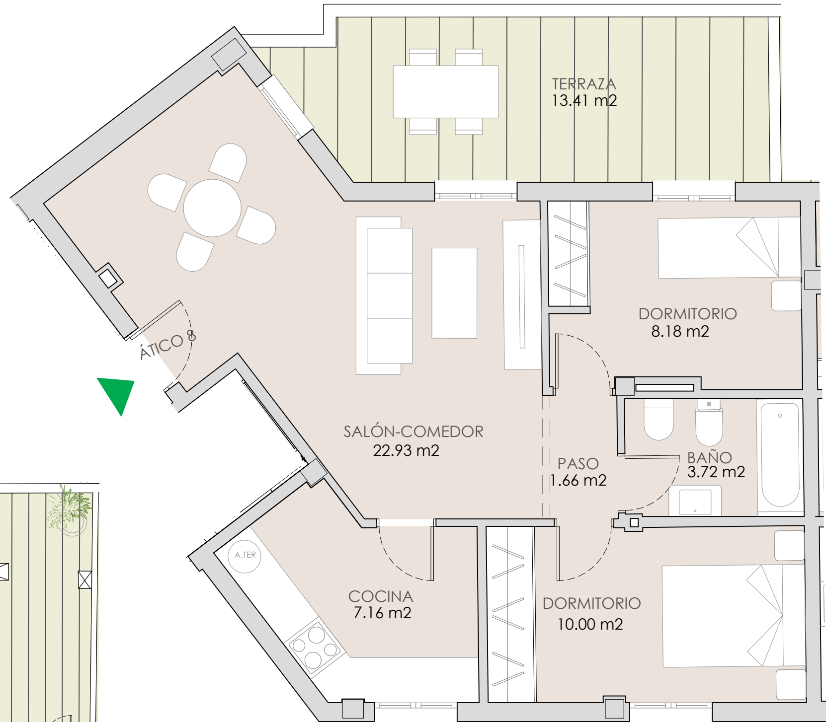
PLANTA VIVIENDA ESCALA 1/50