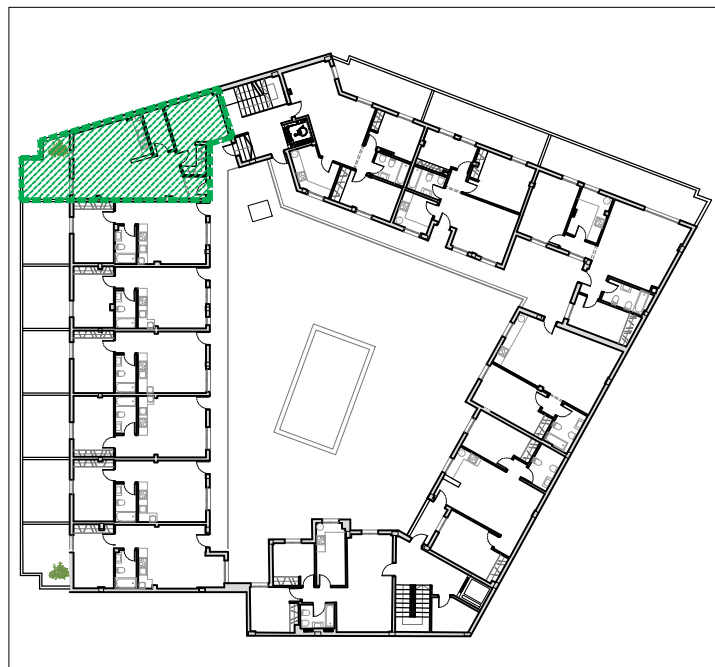
Plano de situación de la vivienda en el edificio