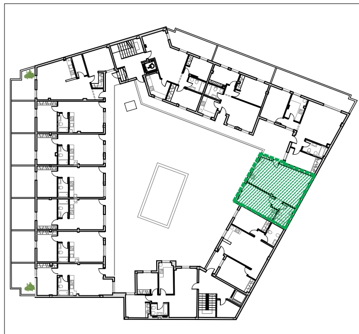
Plano de situación de la vivienda en el edificio