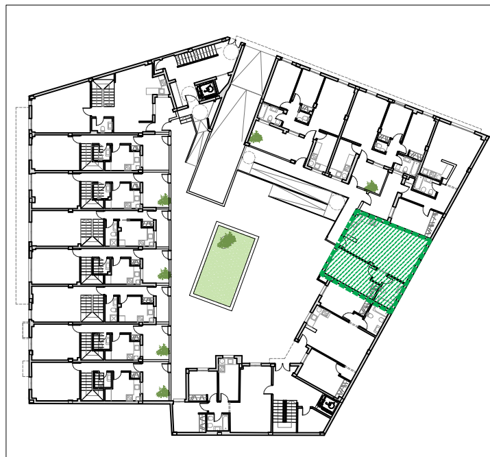
Plano de situación de la vivienda en el edificio