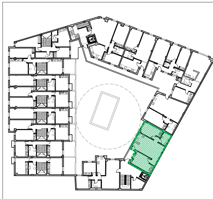
Plano de situación de la vivienda en el edificio