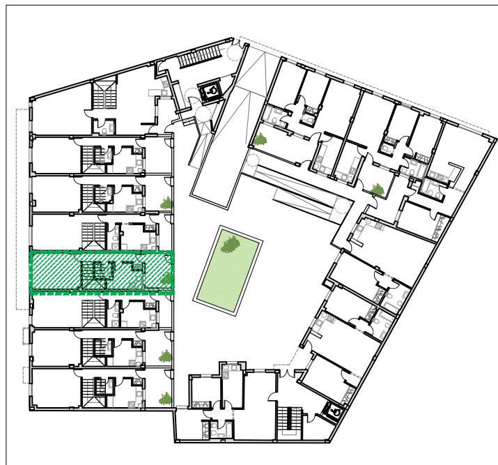
Plano de situación de la vivienda en el edificio